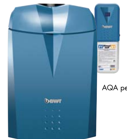
AQA perla Plus