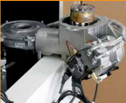
Verbrennungseinheit in Wartungsposition einhängen