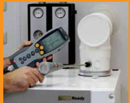
Verkleidung montieren und Verbrennungswerte kontrollieren