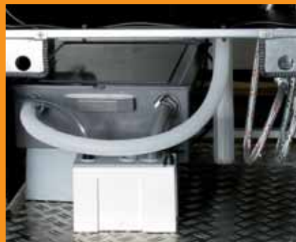
Siphon, Neutralisation und Kondensatpumpe reinigen