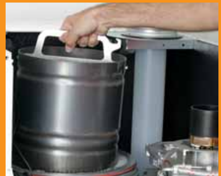
Brennkammer und Verdränger mit Wartungswerkzeug herausziehen