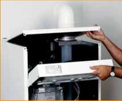
Verkleidung öffnen und den Regelungskasten herunterklappen