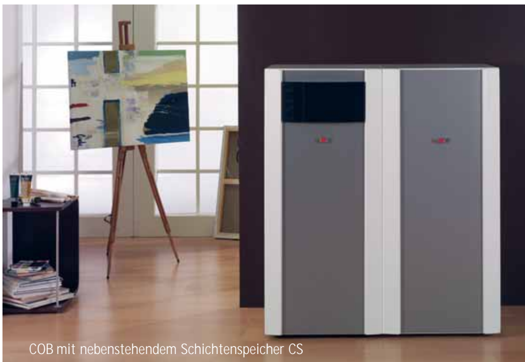
COB mit nebenstehendem Schichtenspeicher CS