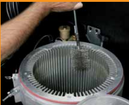
Wärmetauscher mit Bürste reinigen