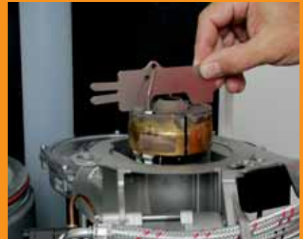
Kontrolle der Zündelektroden